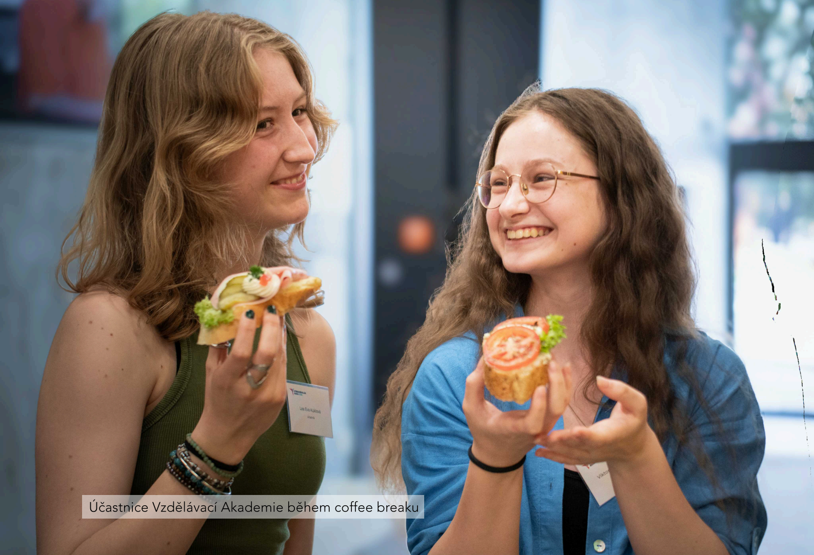
Účastnice Vzdělávací Akademie během coffee breaku