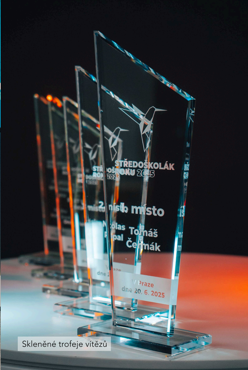
Skleněné trofeje vítězů