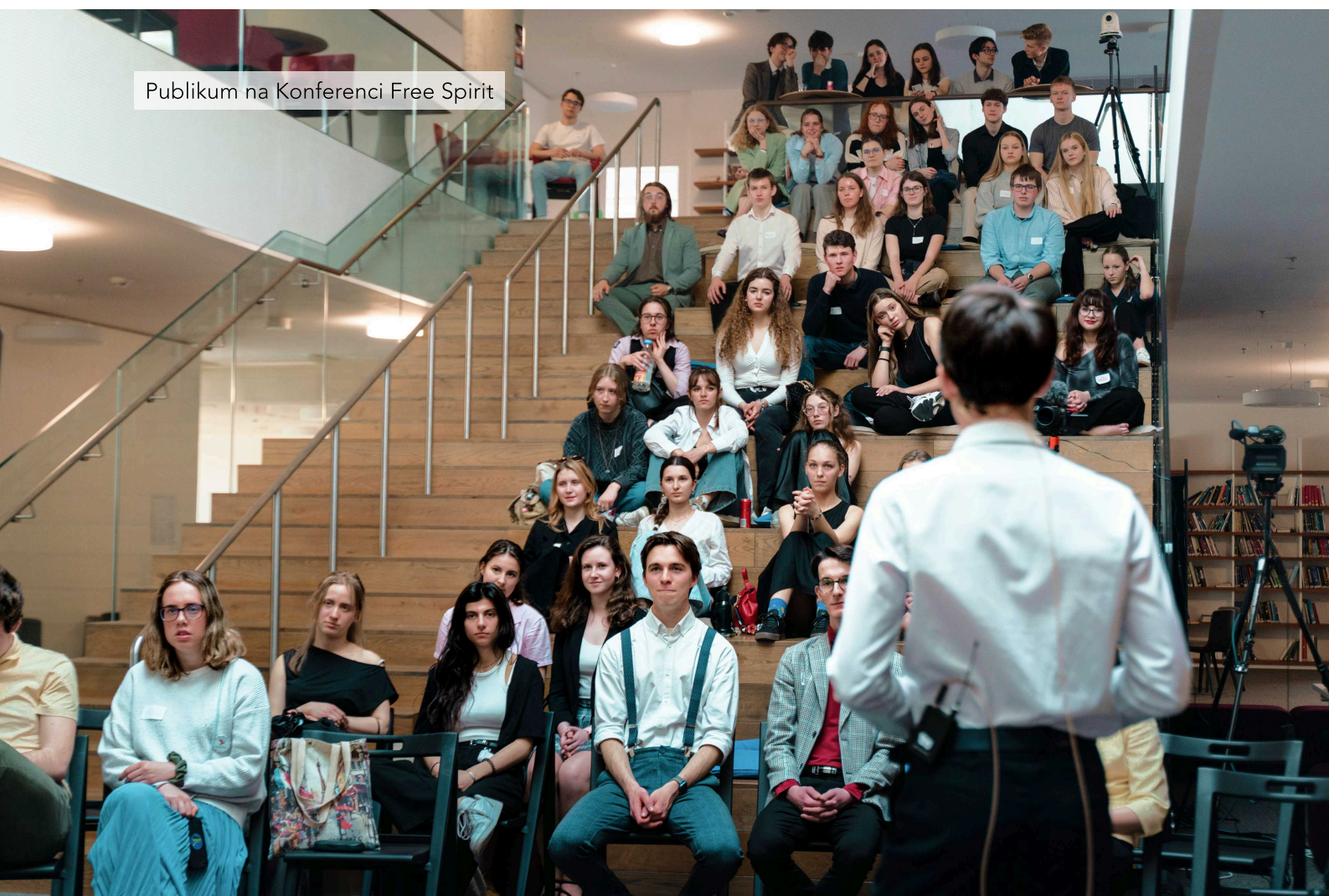
Publikum na Konferenci Free Spirit

Na Konferenci Free Spirit mimo pestrou nabídku přednášejících a rozebraných témat se organizace ProStředoškoláky snaží propojovat mladé a aktivní lidi mezi sebou. A tak mezi přednáškou Tadeáše Vylity a navazující Elišky Konečné, TOP25 z roku 2024, byla hodinová pauza, kterou účastníci využili k seznámení se mezi sebou. Tato pauza byla zpestřena skvěle nachystaným cateringem.