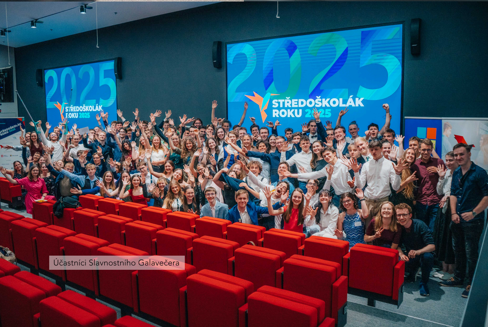
Účastníci Slavnostního Galavečera