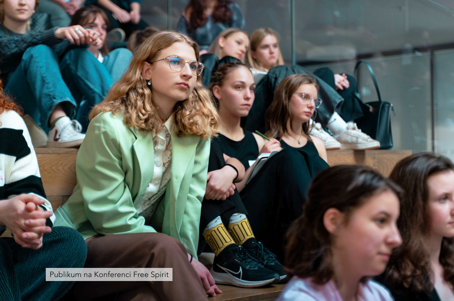
Publikum na Konferenci Free Spirit