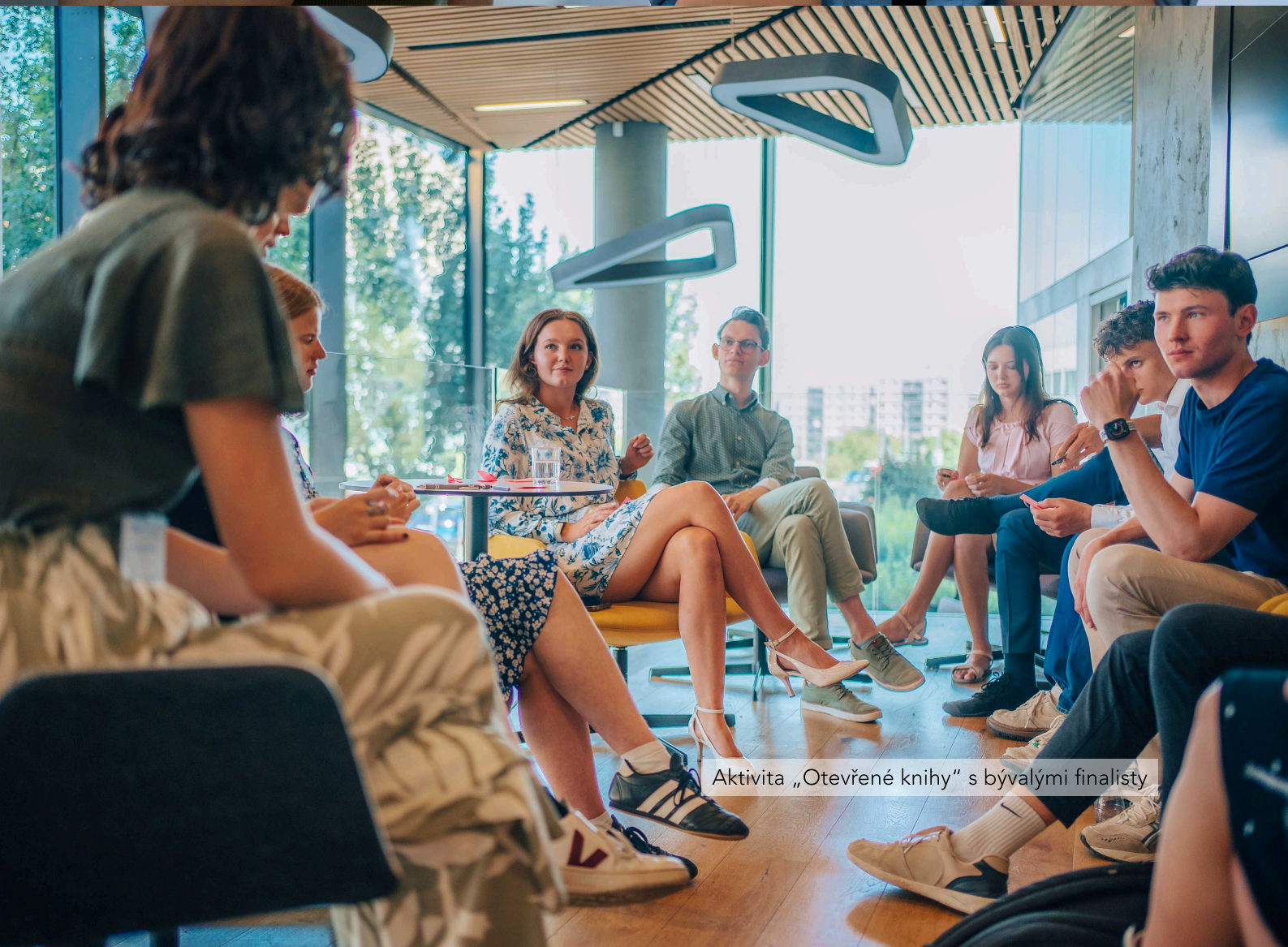
Aktivita „Otevřené knihy“ s bývalými finalisty