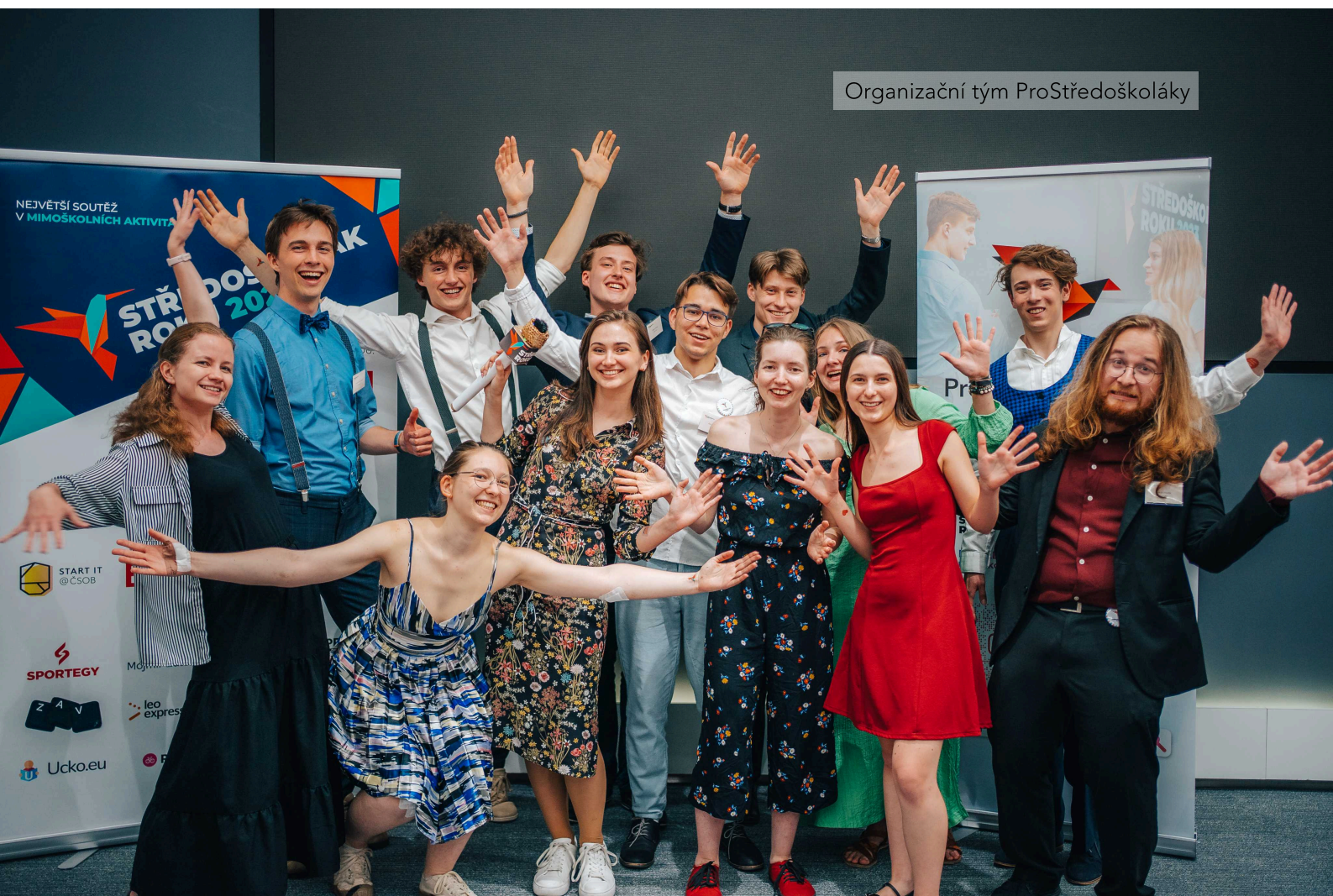
Organizační tým ProStředoškoláky

Zájem o aktivity v roce 2025 dále rostl, což zároveň dokládá, že prostředí, které spojuje a podporuje, má skutečný význam, vytváří konkrétní přínosy a umožňuje studentům komplexně se rozvíjet vlastním tempem. Děkujeme všem studentům, mentorům a podporovatelům, kteří s námi tvoří tuto komunitu.