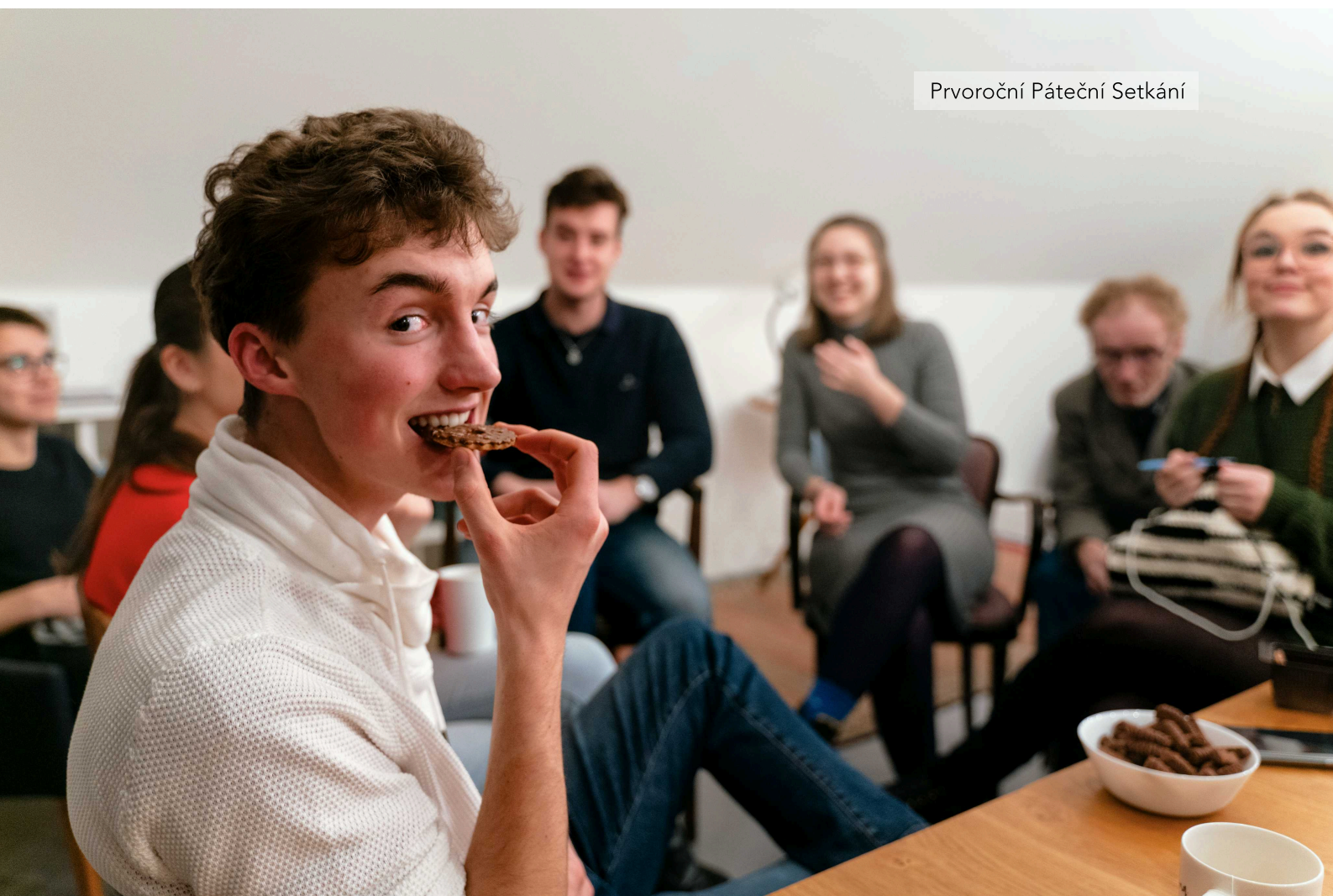
Prvoroční Páteční Setkání

V tomto školním roce proběhlo tedy sedm tematických Pátečních Setkání. Pro každé z nich, stejně jako v letech minulých, poskytla příjemné prostory nadace Bakala Foundation ve svém Student Hubu na Praze 1.