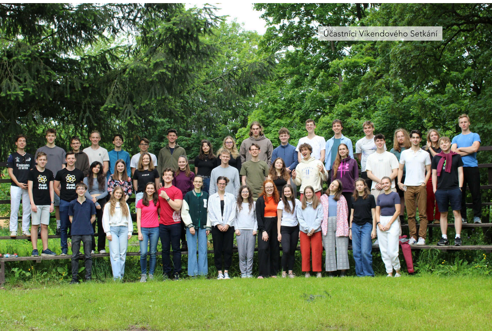
Účastníci Víkendového Setkání

Více z atmosféry Víkendového Setkání je k vidění ve videoreportáži na našem YouTube kanálu .