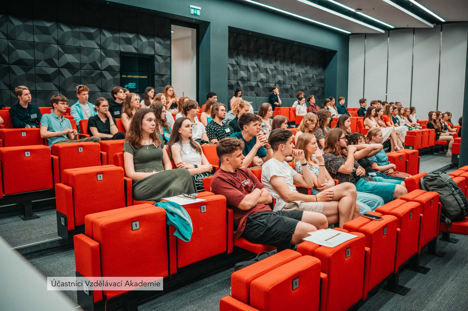
Účastníci Vzdělávací Akademie